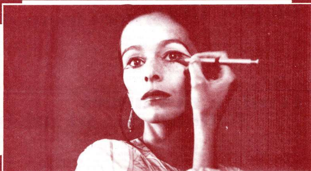
ELISA VIDA MIA

In een ruig en verlaten landschap zie je hoe een jongen door zijn vader zijn barre levensstaat wordt ingeranseld. Alle contact met de buitenwereld blijft hem ontzegd. Overgeleverde tradities spelen een rol, ook op de natuur gerichte vormen van bijgeloof. De jongen is tenslotte het praten verleerd. PADRE PADRONE is een etnografisch meesterwerk. Geluiden en instinkten spelen een belangrijke rol. Je maakt mee hoe animaal mensen kunnen leven. Hoe twee langstreckende muzikanten uit een ver dorp een wereld vol geluid openstoten voor de bijna verstomde herder. Hoe rauw wringen de Sardijnen liederen uit hun keel. De meest primitieve vendetta kan hun moordzucht inspireren. Het is het levende intellect van de jongen in kwestie dat maakt dat hij zijn militaire diensttijd pas mens kan leren worden. Los gesneden van zijn wortels. Een kans die hij aangrijpt waaruit het fascinerende boek is ontstaan dat nu tot het hoogtepunt in het filmoeuvre van de Taviani's heeft geleid. Gouden Palm Cannes 77.